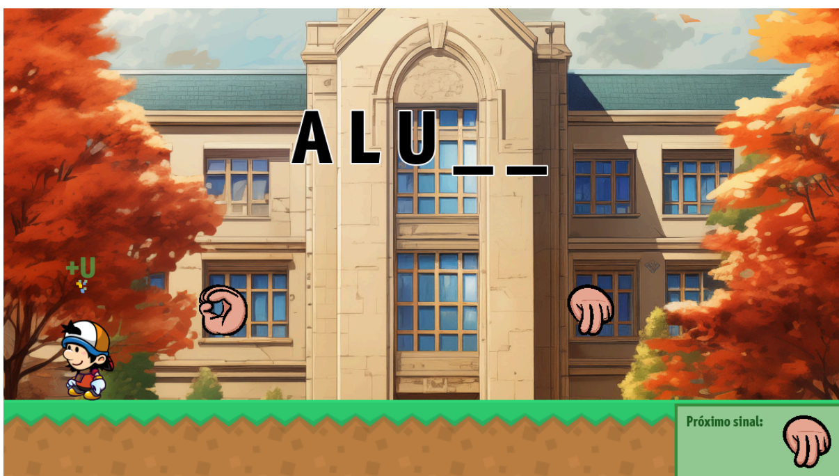
Figura 5 - Ilustração da recompensa visual ao coletar cada letra.