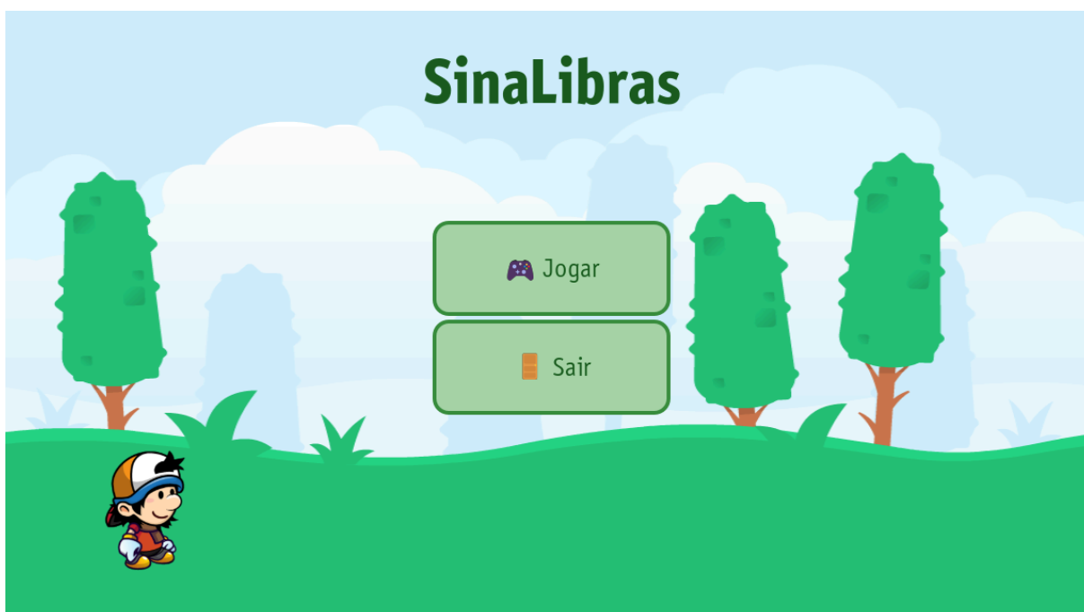
Figura 1 - Interface inicial

A navegação apresenta um fluxo simplificado, com transições suaves e animações que guiam o jogador até o início da atividade principal sem sobrecarregar a interface. Além disso, o design das telas, como ilustrado na Figura 1, foi pensado para gerar uma sensação de aconchego e segurança para as crianças, criando uma atmosfera propícia ao aprendizado.