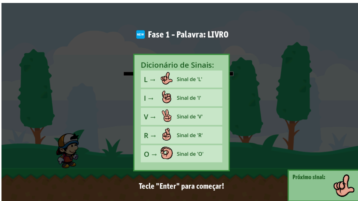
Figura 2 - Tela introdutória das Fases.

permitindo que ela visualize e memorize antecipadamente os gestos, o que contribui para um aprendizado mais significativo.