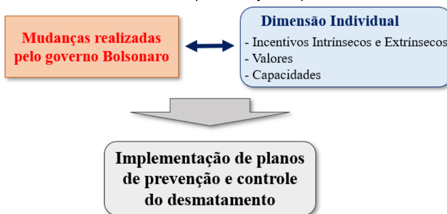
Figura 1. Modelo de análise da implementação da política ambiental brasileira

Conforme reportado abaixo na Figura 1, o novo modelo permitiu testar como as mudanças empreendidas pelo governo Bolsonaro (fatores políticos), mediadas pela dimensão individual, influenciam a implementação da política ambiental brasileira de combate ao desmatamento, na perspectiva dos agentes públicos envolvidos.